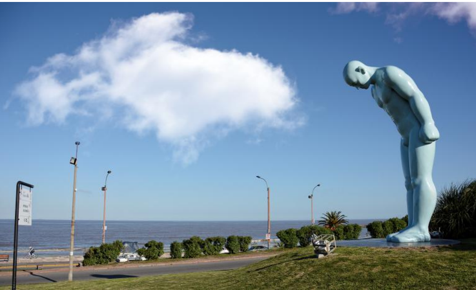
Plaza República de Corea, Rambla de Montevideo - Montevideo

El Crédito Bruto al Sector No Financiero Privado Residente por su parte alcanzó a US$ 12.827 millones, un 1% por encima de 2014. El crecimiento abarcó a todo el sistema, registrando una desaceleración en comparación al año 2014, cuando creció 4%.