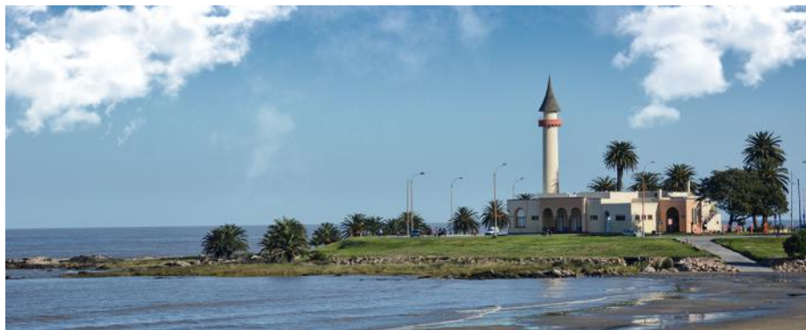
Museo Oceanográfico, Rambla del Buceo - Montevideo