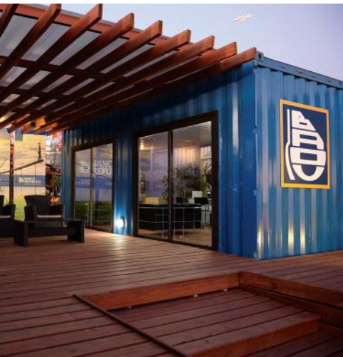
Stand del BROU en la Expo Activa - Soriano

En materia de capacitación, los cursos impartidos durante el año 2015 fueron variados, destacándose los 3 módulos dictados por la Facultad de Agronomía: Taller Lechería (27 y 28 de mayo), Taller Forestal (17 de junio), y Taller Hortifrutícola (8 de octubre), dictados a funcionarios del Cuerpo Técnico de nuestra Institución.