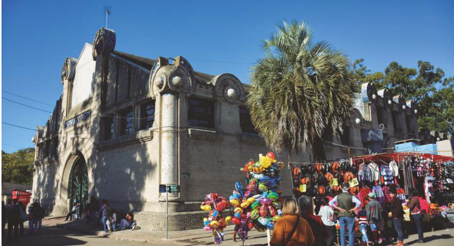
Expo Prado, Rural del Prado - Montevideo