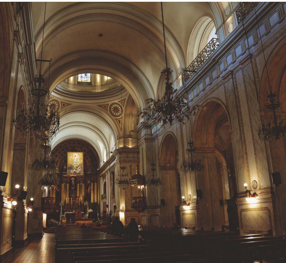
Catedral Metropolitana - Montevideo