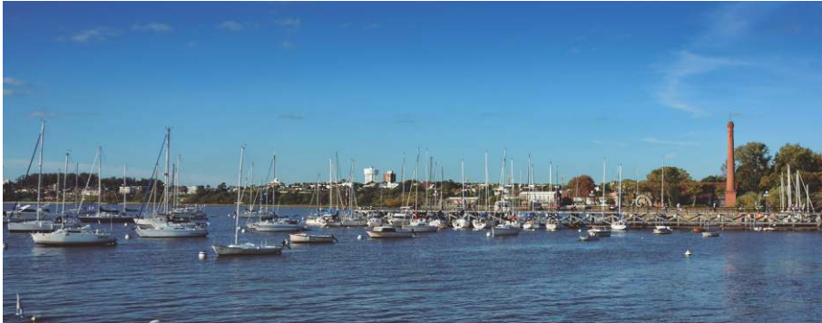
Puerto de Colonia del Sacramento - Colonia