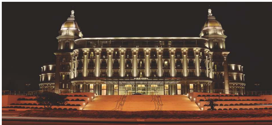
Hotel Sofitel Casino Carrasco - Montevideo

Los patrimonios de las dependencias del Banco en el exterior ascienden al 31 de diciembre de 2013 a: