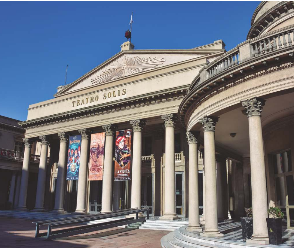
Teatro Solís - Montevideo