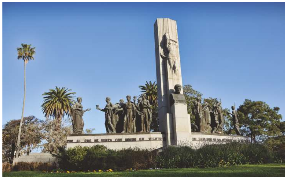
Monumento a José Enrique Rodó - Montevideo

Sus principales cometidos refieren a definir lineamientos y objetivos en materia de Tecnologías de la Información, procurar los medios para alcanzarlos y realizar el seguimiento de los mismos.