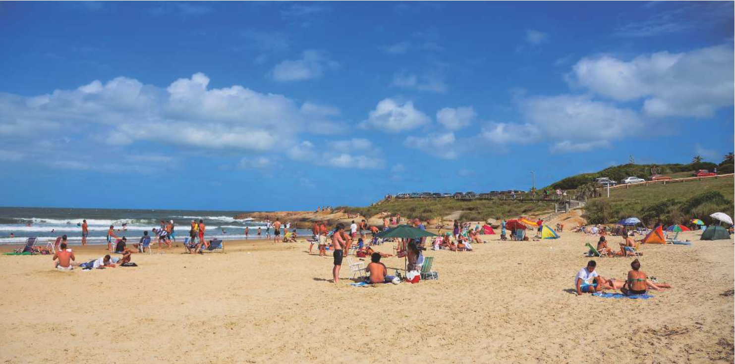
Playa "La Moza", Santa Teresa - Rocha