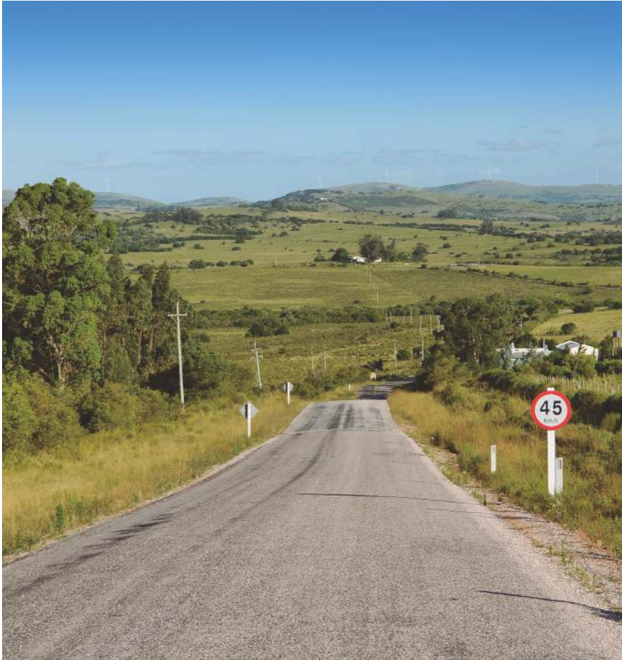
Sierras de Minas - Lavalleja

En materia de transparencia cabe señalar que el Banco cuenta a su vez con la Unidad de Coordinación de Información Corporativa. Dentro de los límites que el marco jurídico relativo al secreto y reserva bancaria imponen, dicha Unidad tiene a su cargo el intercambio de información con organismos externos, siendo su objetivo garantizar los derechos fundamentales de las personas de acceso a la información pública y a la protección de datos personales, promoviendo la transparencia de la gestión de toda la Institución.