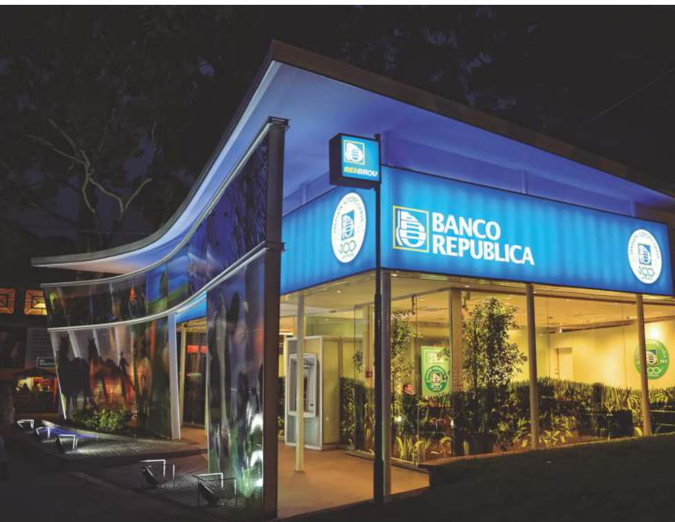
Stand del BROU, Rural del Prado - Montevideo

Se destacó el crecimiento constante en la financiación de Inversiones producto de la mayor tecnificación que continúa realizando el sector a través de la ejecución de Proyectos que son modelo para el país y la región. Por otra parte, un incremento no menos importante registró el monto colocado en capital circulante, producto de la expansión de la agricultura con mayores áreas financiadas por el Banco y el mayor valor del ganado de reposición.