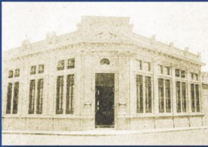
Sucursal SAN JOSÉ