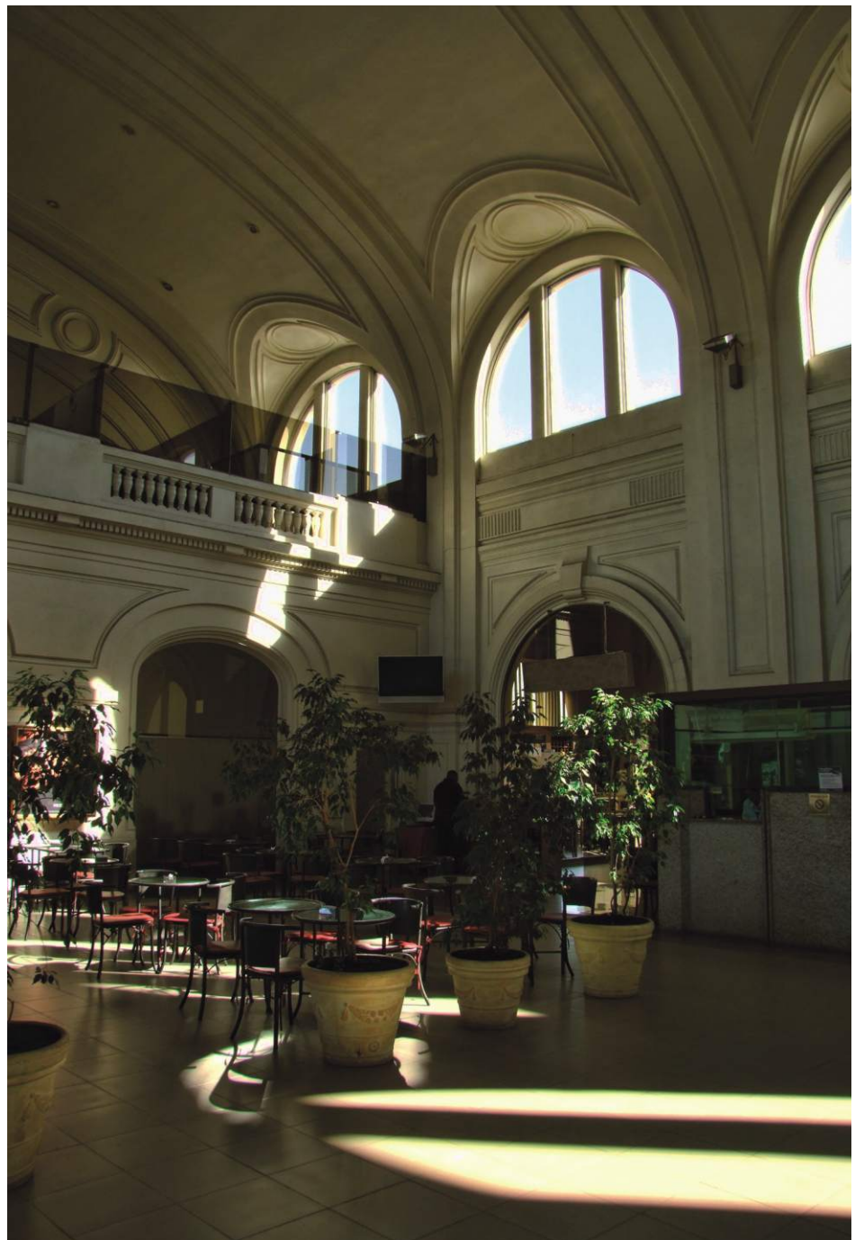
Pabellón de Pasajeros del Puerto de Montevideo