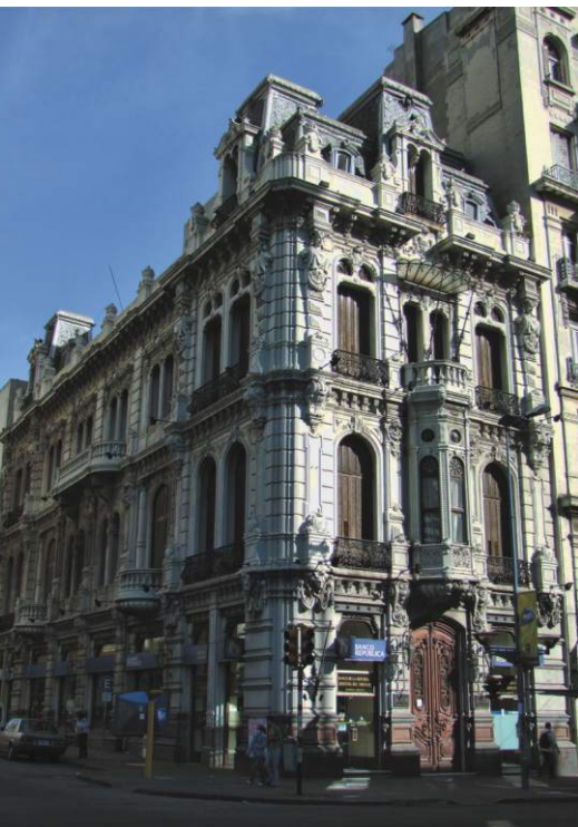
Museo del Gaucho y de la Moneda del Banco República - Montevideo